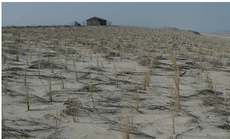
Là, protection des dunes, bravo !