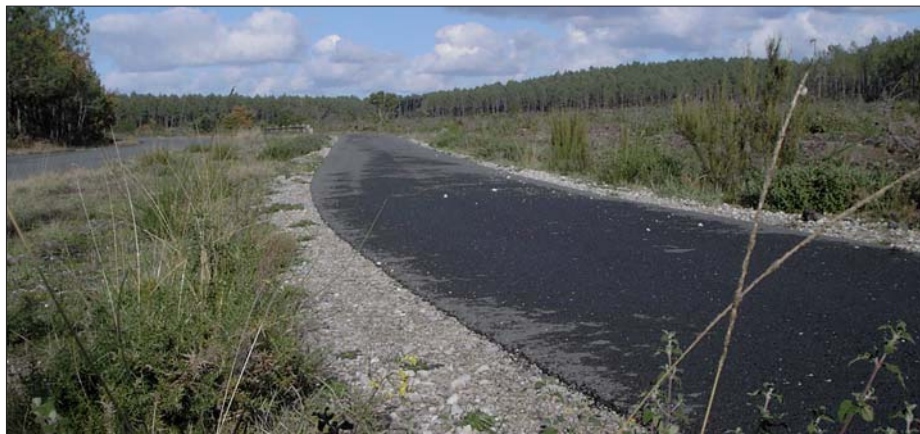
Ici, coupe rase, hélas !

bords des pistes. En ces temps du renouveau des «deux-roues», les promenades en forêt font de plus en plus d'adeptes au point que, durant les mois d'été, certaines pistes se retrouvent rapidement proches de la saturation.