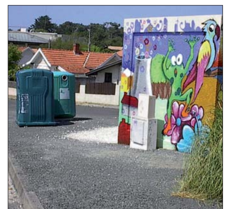
... mais conteneurs à déplacer

Et notre administratrice de proposer des solutions qui mériteraient au moins d'être étudiées. Ensemble.