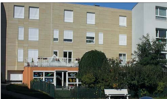
Une bien agréable résidence pour personnes âgées

Chaque personne âgée doit trouver à sa disposition des lieux et des activités internes répondant à son état présent. Personnaliser l'espace intérieur est