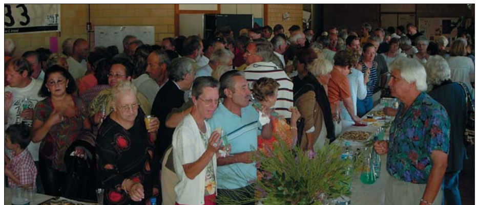
La manifestation s'est terminée par le pot de l'amitié