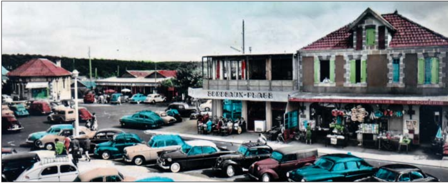
Les allées Ortal

cadre de vie pour tous, qu'ils demeurent ou passent, se faisant les ambassadeurs d'une ville où il fait bon vivre, où le gigantisme n'a pas sa place, ce qui est un des charmes que nous devons nous appliquer à conserver » lit-on dans l'éditorial de ce bulletin.