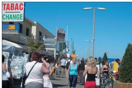
Les allées Ortal