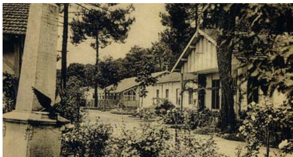
Ce que fut l'entrée du Centre Médico Scolaire

Le devenir des personnes âgées n'est plus aujourd'hui un sujet tabou. Depuis la canicule de l'été 2003, les Français ont pris conscience de ce problème social. A Lacanau la population s'accroît. Notre commune, et notamment à Lacanau-Océan, abrite de plus en plus de couples aux «têtes blanches» qui viennent s'y retirer définitivement. Elle n'échappera donc pas à cette poussée démographique. Elle doit donc se pencher avec détermination sur ce problème de société. Certes, la municipalité a entamé une réflexion, créé un comité de pilotage auquel participe l'Aplo (cf. les VLO précédents). Mais long sera le chemin avant que ne soit donné le premier coup de pioche. Car nombreuses, documentées, avisées, renseignées, doivent être les réunions de travail. Celles-ci doivent rassembler autour d'une même table outre les représentants des élus, ceux des administrations territoriales et des associations locales. Des experts compétents viendront éclairer ces participants sur ce programme de la plus haute importance.