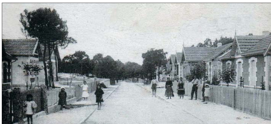
Rue René Marthiens dans les années 1930

Espérons que les propositions de l'Aplo (cf VLO 2002) : circulation à sens unique rue Plantey et avenue de l'Europe et retour Place Charles de Gaulle et avenue Henri Seguin, seront prises en considération par nos élus dans les meilleurs délais.