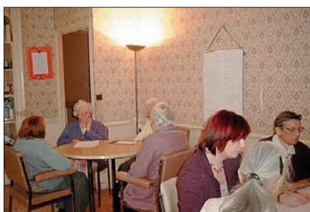
Lieu de vie

«Les promoteurs, les gestionnaires, les investisseurs doivent comprendre que l'excellence et la qualité doivent être au rendez-vous et qu'un des moyens pour y parvenir est de construire des lieux de vie et non d'hébergement et