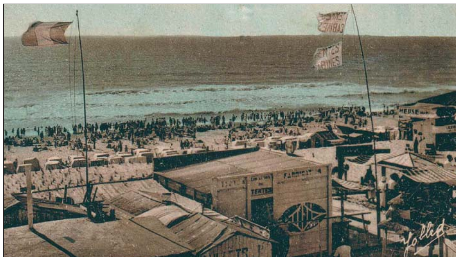
L'entrée de la plage

VO n° 12 janvier 1986 : « L'Aplo, c'est la défense des propriétaires dans leurs droits, mais c'est aussi l'expression de ses 600 adhérents pour une collaboration permanente à l'amélioration du