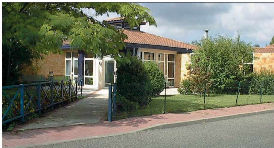
La maison de retraite à Lacanau-Bourg