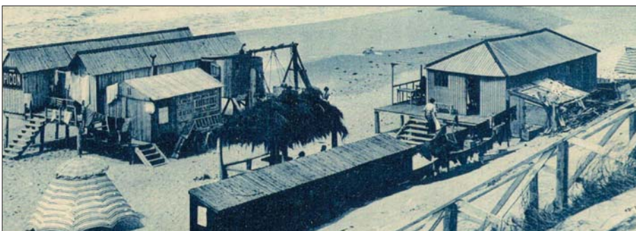
Cabines pour les bains et Etablissement Lacaze

Nous profitons donc de cette circonstance pour appeler aujourd'hui ces dernières à nous contacter si elles souhaitent véhiculer des informations à tous nos lecteurs, notre périodique étant lu, nous le rappelons, par plus de 3000 d'entre eux.