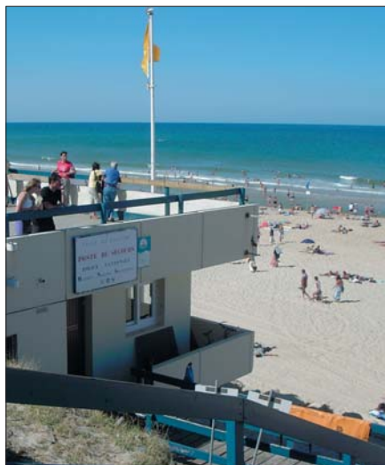
Vue du poste central

Enquête conduite et rapportée par Marie-Claude Houalet. (été 2005).