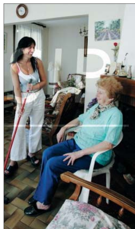
Aide à domicile